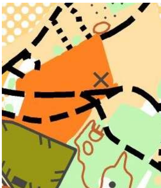
Speciální znak 839 použitý v mapovém klíči