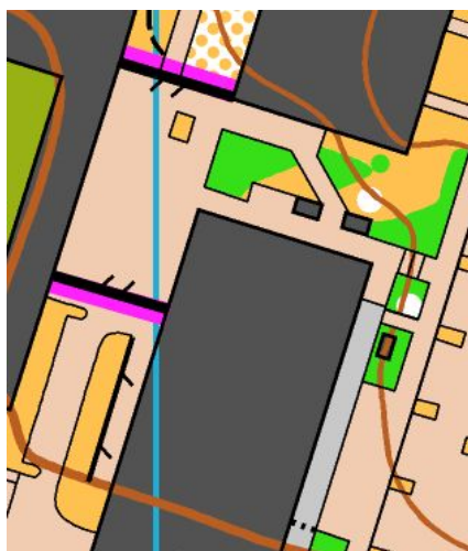
Umělá překážka v mapě

Dále bude zakázáno překonávat umělé překážky vyznačené v mapě kombinací nepřekonatelného plotu (524) a nepřekonatelné hranice (707) (pro lepší čitelnost). V terénu vyznačeno páskou. Mohou se s tím setkat jen kategorie DH16-45.