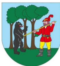
VYSOKÉ NAD JIZEROU