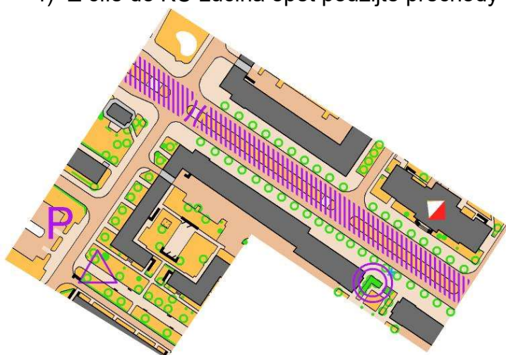
Cesta na start