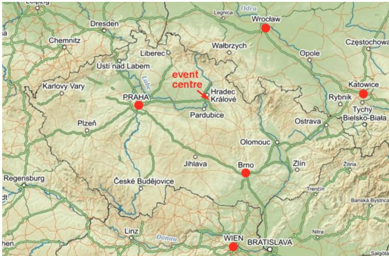
Mapa regionu, umístění letišť a centra závodu

ČESKÝ POHÁR, WRE, INOV-8 CUP – ŽEBŘÍČEK A KRÁTKÁ TRAT / MIDDLE · KLASICKÁ TRAT / LONG HODĚŠOVICE, KOLIBA · 9. – 10. 9. 2023