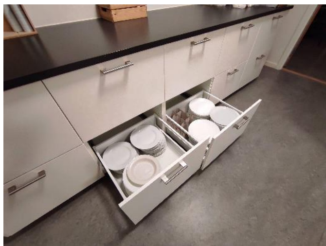
Kuchyň Pro nás oběd a večeře